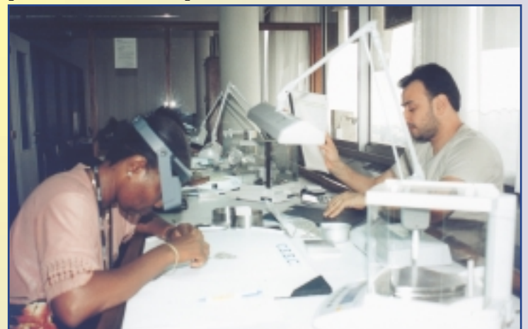
Scène de triage

Le CEEC a l'ambition de devenir et se maintenir comme référence en RDC, en Afrique centrale et australe dans l'évaluation et l'expertise des matières précieuses et semi-précieuses.